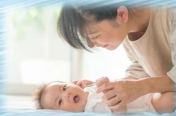
ベビーマッサージ パパ・ママ教室