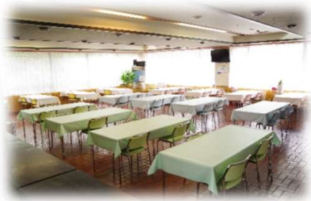
2Fレストラン（席数120席）

国産、県産、地元食材にこだわった全て無添加の「体にいいものがごちそう」の考えのもと 手づくりでご提供しております。