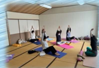
リンパコンディショニング ヨガ教室