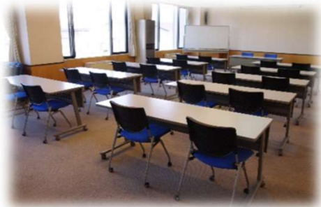
第2セミナールーム（2F）